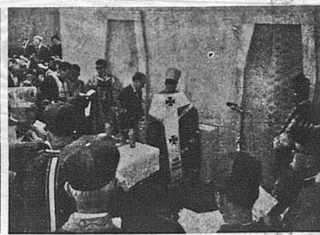
Будівля нової катедрі Непорочного Зачаття Пречистої Діви Марії в день благословення її наріжного каменя новозбудованої катедрі.