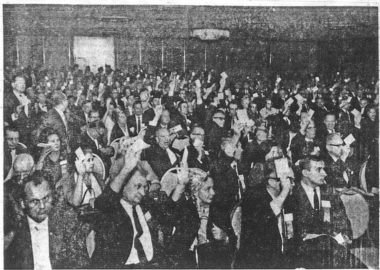
ГОЛОСУЙМО! Голосування належить до найбільшого привілею демократичного суспільства, а на нашому Дев'ятому Конгресі воно було зокрема популярне, як це й видно на цій фотознімці. Трапилось навіть таке, що коли на запит делегата про інформацію, на котрому поверсе є бенкетова зала, один із Президів сказав, що на 3-му, а другий, що на 5-му, то із залі почувлись пропозиції: Голосуємо!

ливого, Конгресу були подані в „Свободі” негайно після його закінчення. Але, кажуть, що часом одна ілюстрація варта 1,000 слів, тому до слів додаємо ще й ілюстрації, що їх поставив нам до розпорядження їх виконавець, п. Осип Старстак. В нього можна й замовляти ці та багаті інших фотознімки з Конгресу, звертаючись на адресу: J. P. Starostiak, 1881 Linden St., Brooklyn, N.Y. 11227.