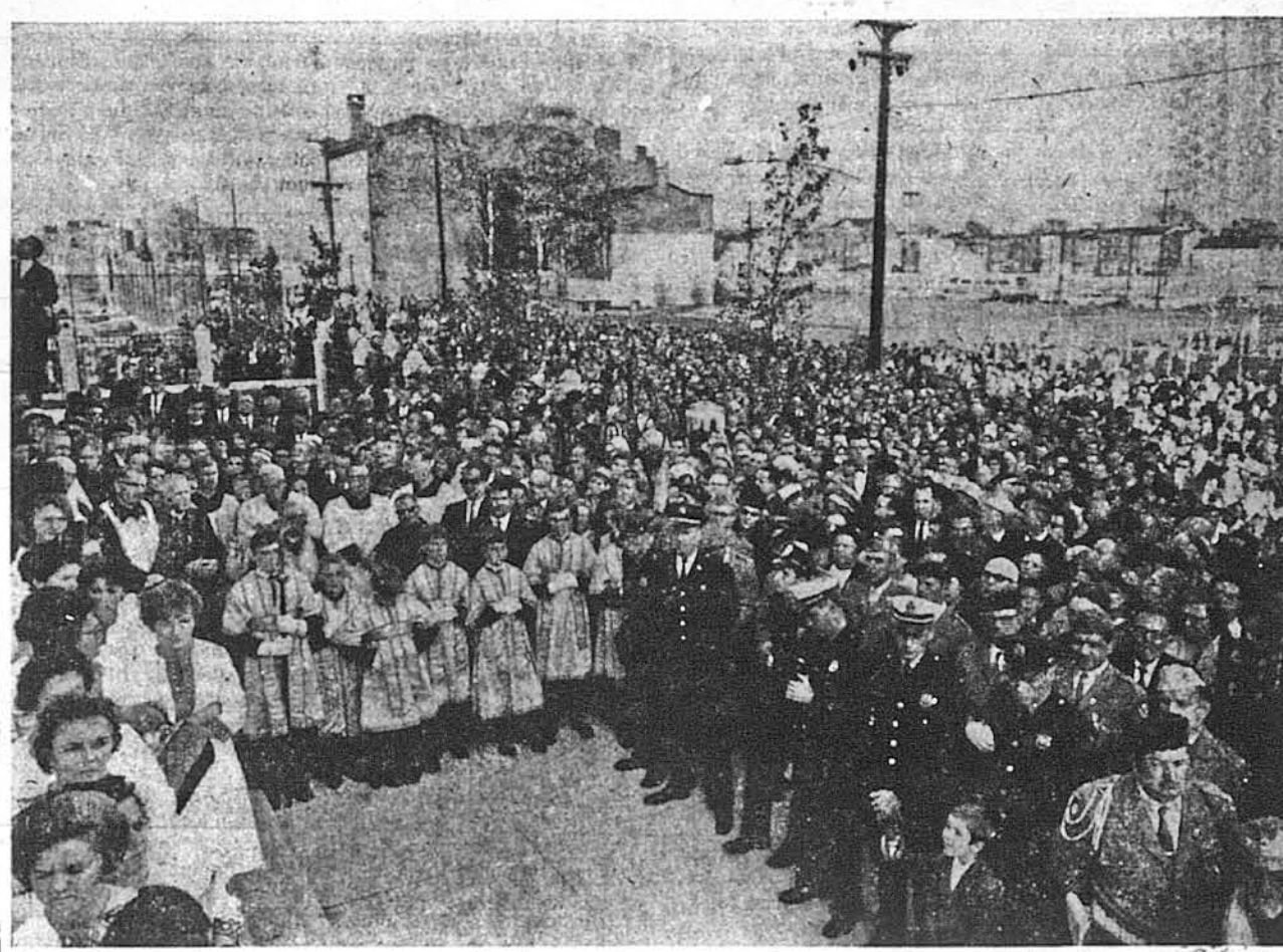
Священники із вітряними хлопцями та зібрані маси вірних на площі перед катедрою в неділю 16-го жовтня 1966 р.