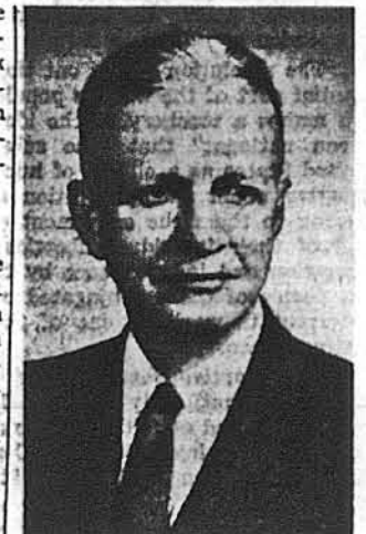
Rep. Francis E. Walter (D., Pa.)

"It is repulsive to me that a United States government agen-